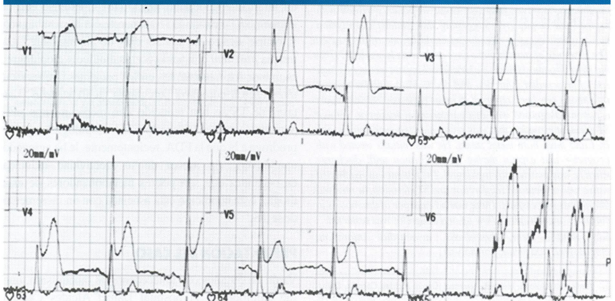
Figura 2. Electrocardiograma que muestra un infarto de miocardio agudo, 10 días postcolocación de stents.

ICP. La coronariografía mostró lesiones en múltiples vasos, con ateromatosis grave en la descendente anterior, asumida como la arteria involucrada. Se realizó ICP con implantación de tres stents metálicos (Figura 1). Durante su hospitalización recibió terapia de doble antiagregación plaquetaria con ácido acetilsalicílico,