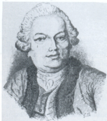
Claude Bourgelat, autor de la obra “Eléments de l’art vétérinaire”, obra fundadora de la verdadera medicina veterinaria científica, publicada en 1761, año en que además fundara la primera Escuela de Medicina Veterinaria en Lyon.

bajadores para el Grupo en sus respectivos países median- te la promoción y la organización de eventos.