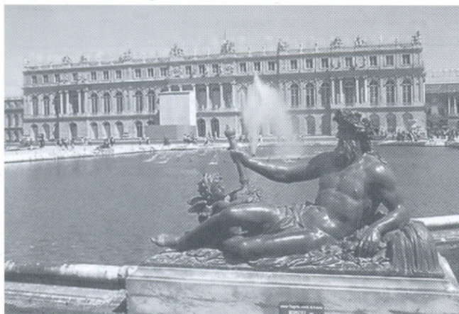
El palacio de Versailles, donde se dio inicio a las celebraciones mundiales dentro del marco de "Vet2011" y donde Luis XV ordenó a Bourgelat la creación de la primera Escuela de Veterinaria en Lyon, Francia.