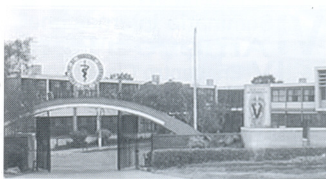
Frontis de la actual Facultad de Medicina Veterinaria de la Universidad Nacional Mayor de San Marcos de Lima.

Algunas de estas Facultades y/o Escuelas, se encuentran aún en las etapas de formación y consolidación; pero todas en el país, tienen ahora el deber de someterse a las correspondientes evaluaciones sobre la calidad de la educación que imparten, que según las normativas vigentes, corresponde al Consejo de Evaluación, Acreditación y Certificación de la Calidad de la Educación Superior Universitaria (CONEAU) fijar los estándares que para el caso de la Acreditación de la Carrera Profesional Universitaria de Medicina Veterinaria han sido publicados en la edición de fecha 7 de Julio de 2010 en el diario oficial El Peruano.