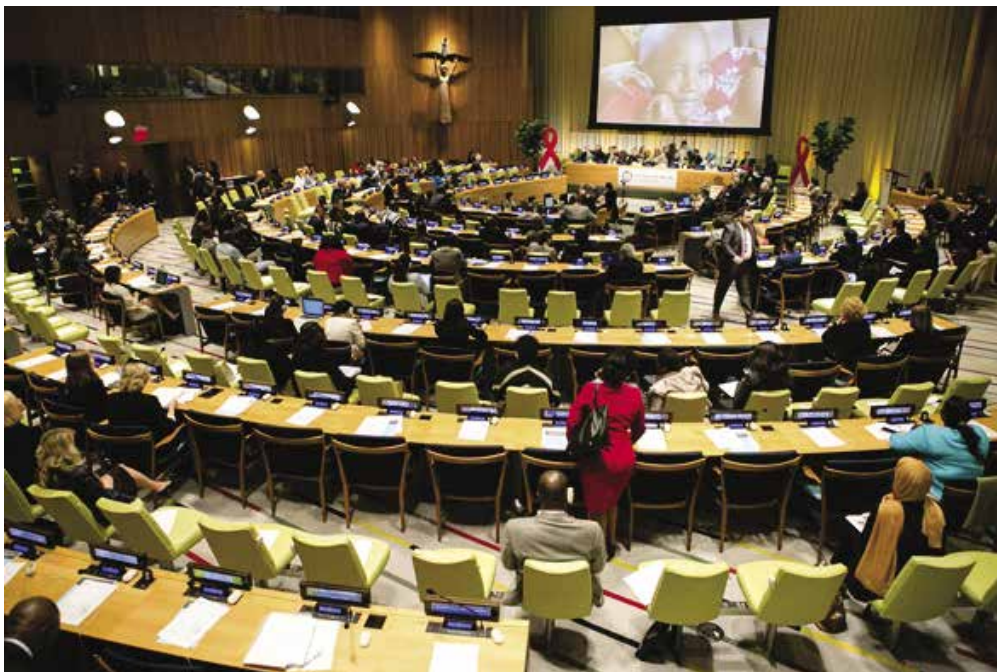
Figura 1. Discusión en la Organización de las Naciones Unidas (ONU), sobre mejoras en la atención de las personas con VIH.

Adicionalmente, la rapidez y gravedad de la epidemia y la necesidad de racionalizar los recursos para su control y prevención dieron lugar al afinamiento y desarrollo de conceptos e instrumentos epidemiológicos entre los investigadores y los trabajadores de salud, y que también se han divulgado a los gobiernos, a los medios de comunicación y la población en general. Por la brevedad de este ensayo, solo destacaremos dos: el uso apropiado del concepto de riesgo y las proyecciones de la epidemia a través del modelamiento estadístico o matemático.