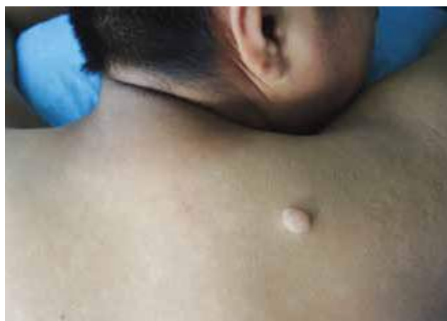
Figura 1. Lesión en omóplato derecho.