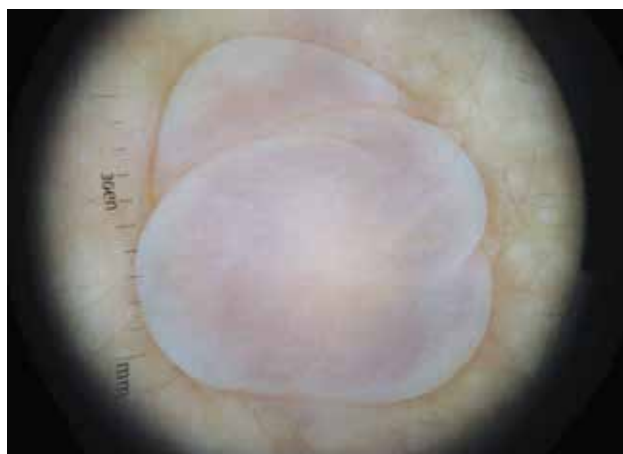
Figura 3. Dermatoscopia.

células de la matriz del pelo. Forbis y Helwig propusieron, en 1961, el nombre de PM. 4,5