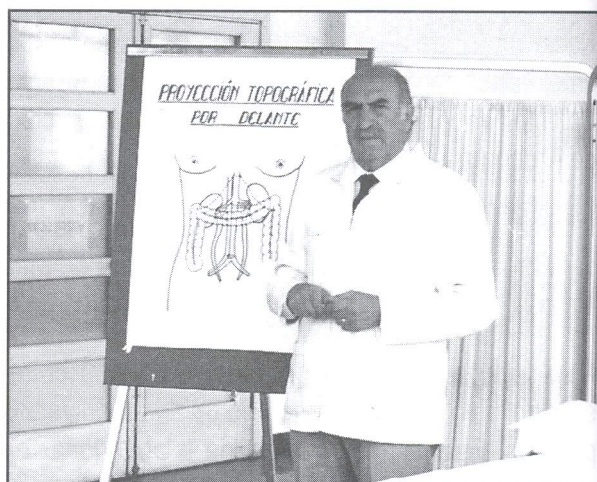
En el año 1970. Dictando clases de Nefrología en las aulas del Hospital Honorio Delgado

En esta gestión, tuve la suerte de integrar su directorio y de ser testigo de su entrega y dedicación a los objetivos propuestos. Durante nuestra gestión se consiguió la adjudicación del terreno y el inicio de la construcción del actual local del Consejo Regional V.