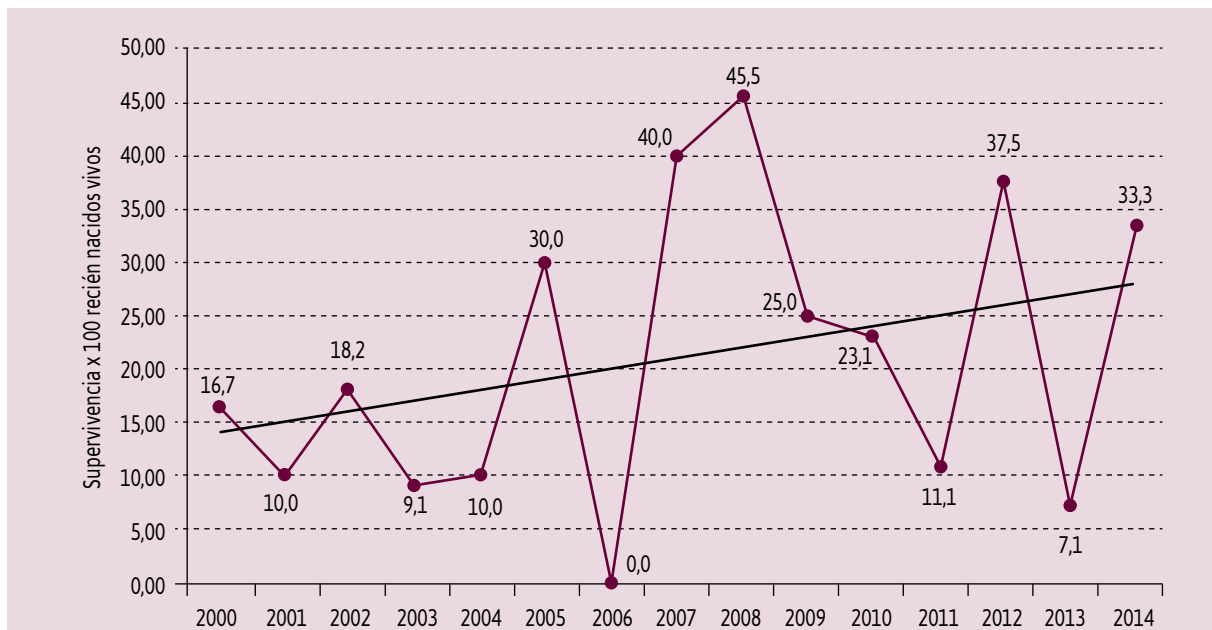
Figura 2. Supervivencia de los recién nacidos con extremo bajo peso. Hospital Hipólito Unanue, de Tacna, 2000-2014

promedio de RN-EBP fue 0,38% por 100 nacidos vivos, con valores entre 0,24% y 0,58%, con una tendencia ascendente durante los quince años de estudio, sin existir diferencias significativas ( p = 0,65 ) (Figura 1).