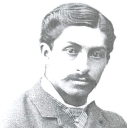
Figura 1. Daniel Alcides Carrión criticaba que atribuyeran a agentes infecciosos la causalidad de la verruga peruana sin haber intentado comprobarlas experimentalmente. 14

La muerte de Carrión llevó a una obsesión científica por conocer el germen causante. Como consecuencia,