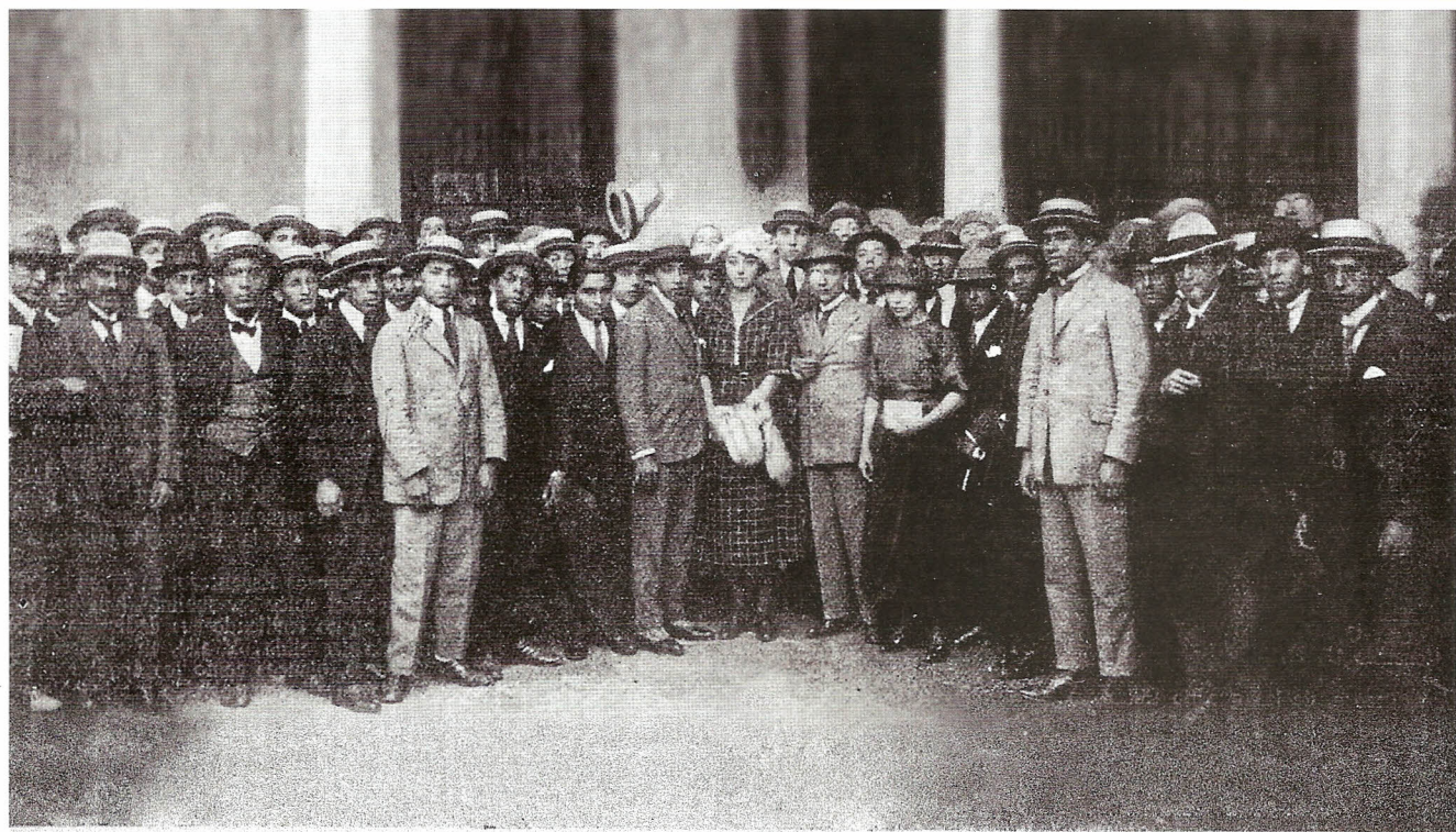
ASISTENTES A LA APERTURA DEL AÑO ACADÉMICO DE 1922 DE LA UNIVERSIDAD NACIONAL MAYOR DE SAN MARCOS