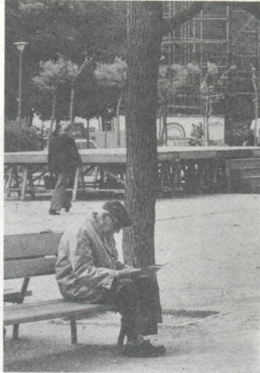
Ancianidad sin preparación para la jubilación

La jubilación y cesantía concebidas como leyes de beneficio al trabajador en su vejez merecen un punto aparte porque se constituye en un serio problema para el ser humano, desde hace años se habla de la preparación para la jubilación pero, por lo menos en nuestro medio hay carencia de programas que brinden esta preparación, generalmente la jubilación pese a ser esperada o no deseada produce alteraciones en la vida del anciano y de su familia, creo sin temor a equivocarme que si no hay una adecuada preparación para el reemplazo de roles al dejar la actividad laboral es cuando se inicia el proceso de involución social.