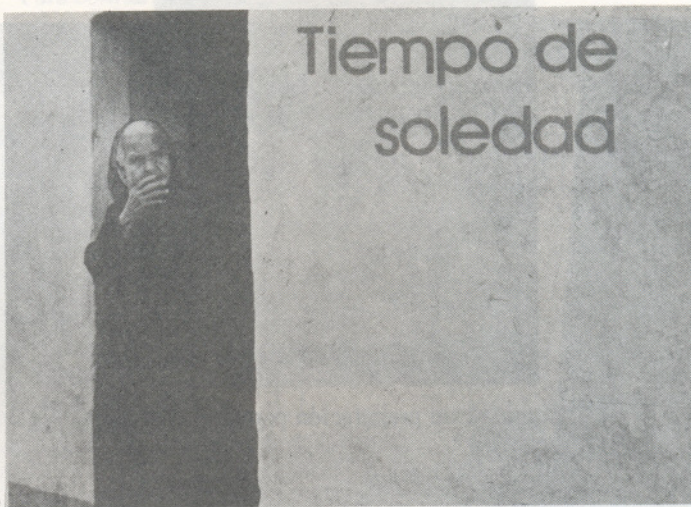
Tiempo de soledad

Tangencialmente hemos tocado el problema de vivienda, el cual en nuestro medio es problema de la mayoría de la población que sin lugar a duda afecta más a los niños y a los ancianos.